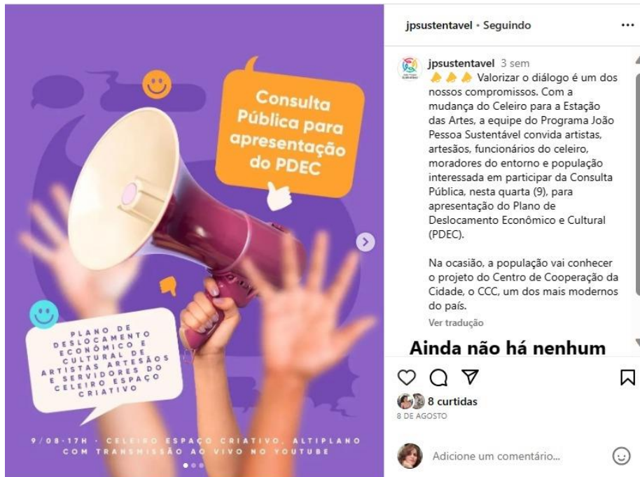
Figura 2. Instagram João Pessoa Sustentável