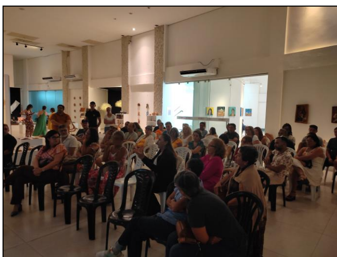
Figura 1. Registros Reuniões Setoriais.