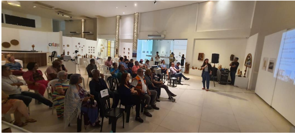
Figura 4. Fotos Consulta Pública